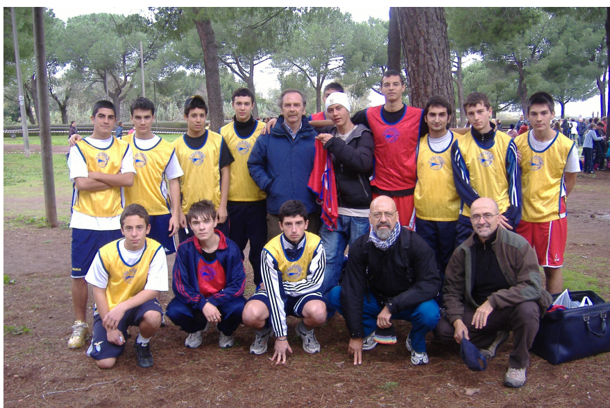
La squadra Allievi e Juniores di corsa campestre