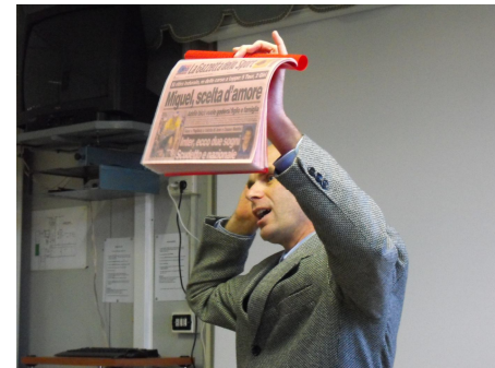
Marchetti mostra i suoi articoli